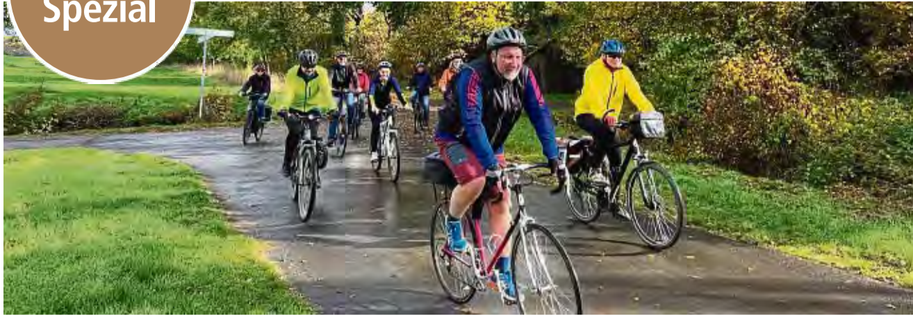
Jeder Kilometer zählt: Ob in der Freizeit in der Gruppe oder alleine auf dem Weg zur Arbeit - jeder Radkilometer hilft, das Klima zu verbessern.