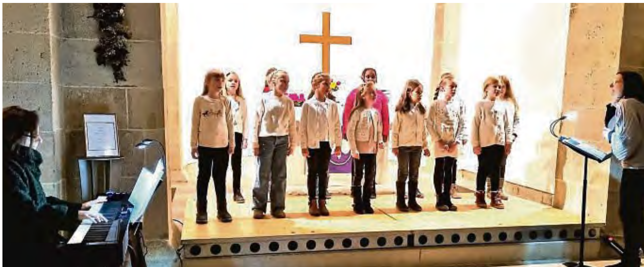
Adventskonzert: Schülerinnen und Schüler der Musikschule chroma treten in verschiedenen Ensembles in der Marienbasilika auf.