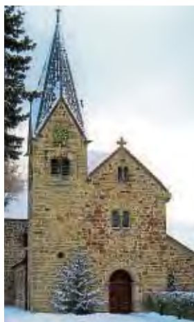
Beeindruckend: Die Marienbasilika in Wilhelmshausen stammt aus dem Jahr 1150.

sikschule schreibt dazu: „Wenn Kinder die ersten Lieder der Vorweihnachtszeit anstimmen, wenn die Klänge der Flöten, Geigen und Blechbläser in das Kirchenschiff emporgetragen werden, dann befinden wir uns mittendrin, im Konzert der chroma.“ Es werden neue und bekannte Werke in unterschiedlichsten Musikstilen und passend zur Adventszeit zu hören sein. In den Ensembles der chroma musizieren fast 200 der über 1200 Schüler und Schülerinnen, die aus den Trägergemeinden Fuldata, Ahnatal und der Stadt Vellmar kommen, um das Musizieren zu erlernen und auszu-